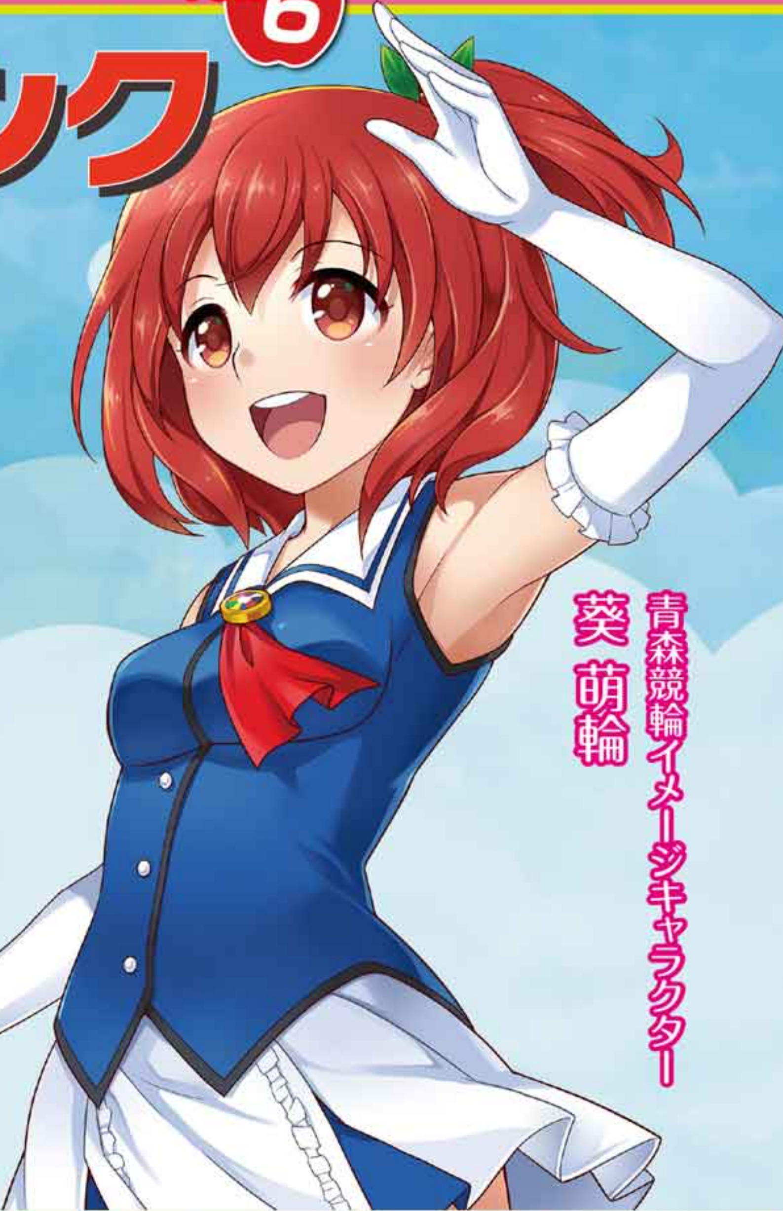
青森競輪イメージキャラクター 葵萌輪