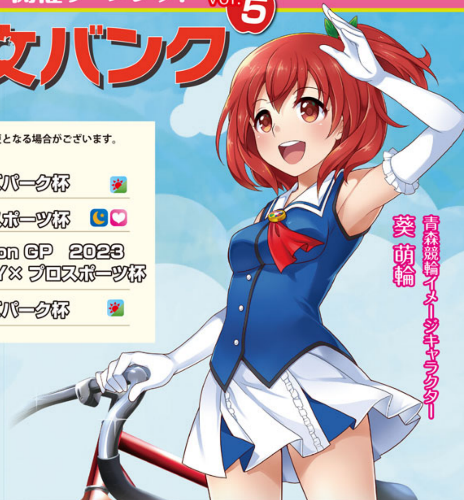
青森競輪イメージキャラクター 葵萌輪